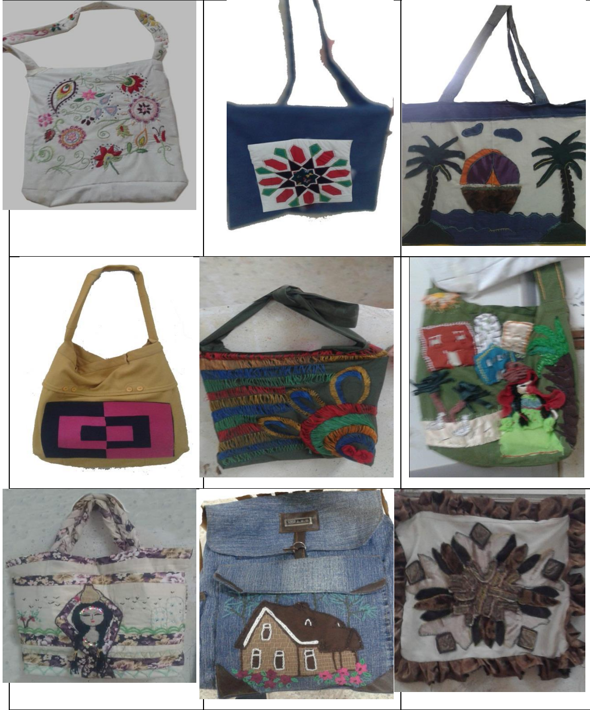
جدول رقم ( ٥ ) نتائج أعمال المحور الرابع من الورشة - ( مكملات ملابس - حقائب ) من بقايا الأقمشة لطلاب الفرقة الثانية، قسم التربية الفنية، بكلية التربية، جامعة السويس